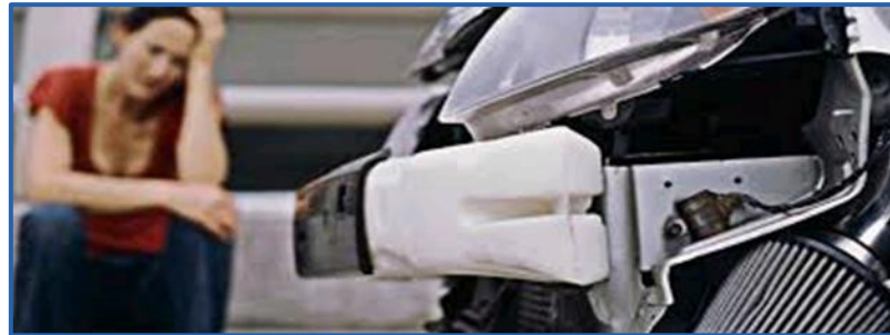
Víctimas en accidente de tráfico (DGT)